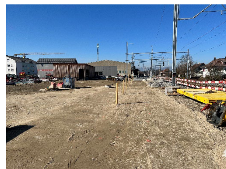
Hier entsteht der Platz für das Be- und Entladen der Bauzüge

Infos zum Bauprojekt: bls.ch/kirchberg-alchenflueh